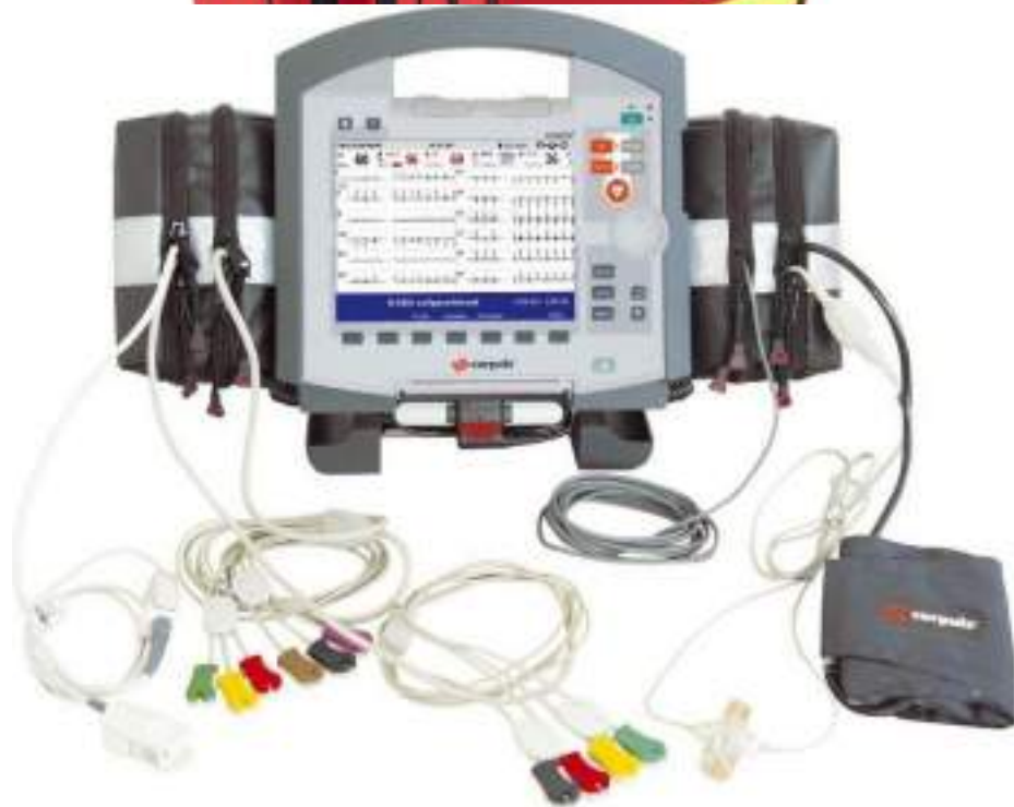
Multiparamétrique & Défibrillateur